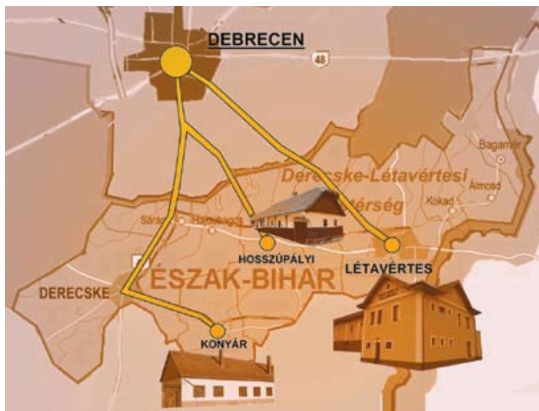
Az Észak-Bihari Muzeológiai Szakszolgálat kisgyűjteményei

Az Észak-Bihari Muzeológiai Szakszolgálat egy önkormányzati társulás fenntartásában működik. A társulást – a helyi önkormányzatok társulásairól és együttműködéséről szóló 1997. évi CXXXV. törvény alapján – Konyár és Hosszúpályi települések önkormányzatai alapították. Ugyan a törvény nem teszi lehetővé a nonprofit szervezetek, egyházak, etc. önkormányzati társuláshoz való alanyi csatlakozását, de biztosítja a szerződéses megbízás lehetőségét, azaz végső soron ezek a szervezetek is be tudnak kapcsolódni a társulások munkájába. Így történt ez Észak-Biharban is, ahol egy muzeális intézményfenntartó egyház (a Vértesi Református Egyház) is társult a két önkormányzati fenntartóhoz. Ennélfogva a szakszolgálat összesen három kisgyűjtemény, a konyári Kurucz Albert Falumúzeum , a hosszúpályi Bódi István Falumúzeum , és a létavértesi Rozsnyai István Muzeális Gyűjtemény szakmai működését koordinálja.