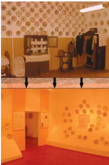
A szakszolgálat szakmailag hitelesíti a kisgyűjtemények kiállításait

Mindezek felismerése, falvaink néprajzi gyűjteményeinek méltatlan szakmai elhanyagoltsága arra késztett, hogy megoldást keressek az „antimuzeális” működés, és a „kérészetlenség” kisgyűjteményi problémáira. Készítettem tehát egy elméleti modellt, amely a kisgyűjtemények ideális szakmai működését mutatja be. A modell három eleme a következő: