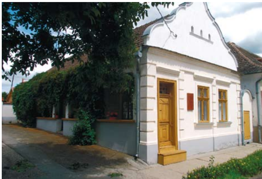
A tájház

Nem szeretnék az öntömjénezés hibájába esni – mivel szerintem a munka többsége, és neheze még most jön majd –, de csak egy egyszerű tájházvezető. Kell egy nagy adag elszántság, sok-sok ráfordított idő, önerő, és nem utolsósorban segítő-