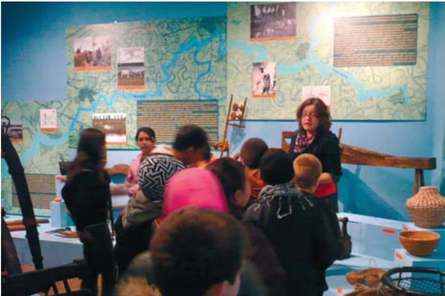
Múzeumpedagógiai foglalkozás a kiállításban

második felétől már, mint kása étel az emberi táplálkozásban is egyre fontosabb szerepet kapott. A nagyvárosok közelsége jelentős fejlődést eredményezett a térség kertkultúrájában is. Az észak-bihari települések külön-külön egy-egy zöldség-, vagy gyümölcsféle termesztésére specializálódtak. Konyár a dinnyetermesztéséről vált ismertté a debreceni, váradi piacokon. Konyár térségének szőlőterületei az észak-bihari homoki bortermő vidékhez tartoztak, melynek története a 16–17. századig nyúlik vissza. Konyár első szőlőskertje is valamikor a 17. század végén települhetett. A szőlőtermesztés igen korán népszerű lett Konyáron, már a 18. században sem akadt olyan tagja a helyi társadalomnak, aki legalább egy kisebb szőlőparcellával ne rendelkezett volna. A szőlőművelés rendre az idős férfiak feladata volt. A szőlősgazdák leginkább önellátásra termeltek. A szőlőskertek szórványgyümölcsösei a családi gazdaságok éves gyümölcsszükségletét is kiválóan kielégítették.