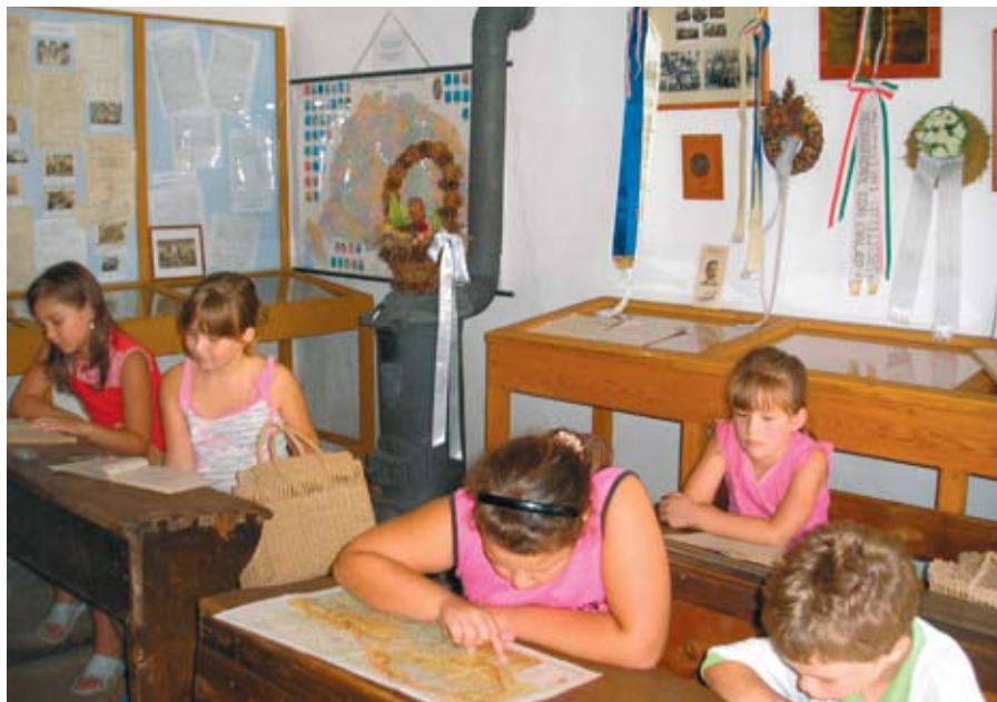
Hagyományörző osztály

A felnőtt korosztály oktatása szintén lehet a múzeumpedagógus feladata, de ezzel már a múzeumandragógia foglalkozik. A múzeumpedagógiai, múzeumandragógiai foglalkozások elsősorban a múzeumlátogatók oktatásának a segítségére vannak. Segítenek szemléltető módon magyarázni a múzeumi tartalmakat, kérdéseket feltenni, új összefüggéseket találni, fokozni a múzeumlátogatók érdeklődését. Ez egy kétoldalú kapcsolat a múzeum és a közönség között. (Juva, 2010, 21.o) A látogatók bevonása a kiállításba nem csak a gyerekek számára biztosított előjog. Egyfajta együttműködés a felnőtt látogató és a tárlatvezető között szintén megengedett, sőt az új múzeumpedagógiai irányzatokat követve ez követelmény is. Reagálnia kell a mai múzeumnak és múzeumpedagógiának a globalizált világ igényeire, a formális és informális oktatás és művelődés lehetőségeit biztosítani kell. A kulturális és szabadidő „iparág” megköveteli a múzeumoktól, hogy aktívak és nyitottak legyenek, felkeltsék az érdeklődést. Reagálniuk kell a társadalmi elvárásokra, hogy a modern múzeum szerepét töltsék be, és mint kultúrintézmény biztosítsák az „egy életen át” történő művelődés és tanulás lehetőségét. (Juva, 2010, 22. o)