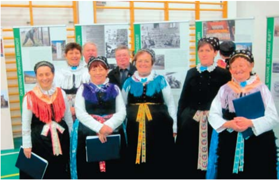
A kiállítás Nagynyáradon

nem zártak. Szatmár abban különbözik a többitől, hogy oda szinte csak magántelepítések zajlottak. Ezeken a részeken élnek az úgynevezett „Duna-menti svábok” (Donauschwaben). A megnevezés az 1920-as években keletkezett, és később vált a német kisebbség gyűjtő megnevezésévé.” – olvasható a kiállítás egyik táblóján.