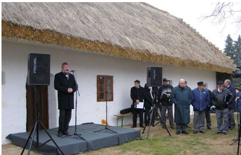
Fotó: Zágórhidi Czigány Ákos

(Vidékfejlesztési Minisztérium Sajtóirodája)