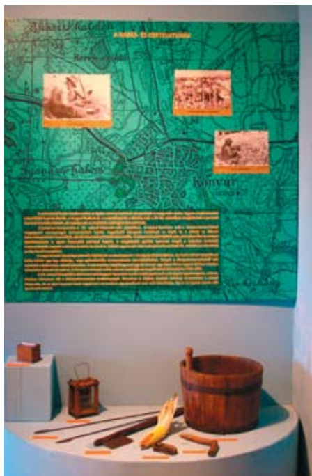
A kapáskultúrák kiállítási egysége

2011. október 16-án új időszaki néprajzi kiállítás nyílt Konyáron. A kiállítás tematikáját a paraszti gazdaságkultúra képezi, ami igen sokat változott az elmúlt századokban. Minden változás közül a 19. századvégi belvízrendezés tekinthető a legjelentősebbnek, hiszen ez vetette meg jelenkorunk kiterjedt gabonagazdálkodásának alapjait. Ezt megelőzően Konyár és a Kálló-mente egész térsége a Sárrétek vidékének északi határsávját alkotta. E térség területének 40–60%-át az év nagy részében víz borította, határa összefüggő mocsárvilágot alkotott. A vízmentesítő munkálatok azonban jelentősen kiszélesítették a térség megélhetési kereteit, ami a helyi közösségeknek lehetőséget adott a polgári életmódelemek fokozottabb átvételére, a társadalmi felemelkedésre. A kiállítás témája tehát a 19. század fontos gazdaság- és társadalomnéprajzi változásaira világít rá, és ezzel a Nemzeti Kulturális Alap „ A Fel-emelő Század ” című országos programjához csatlakozik.