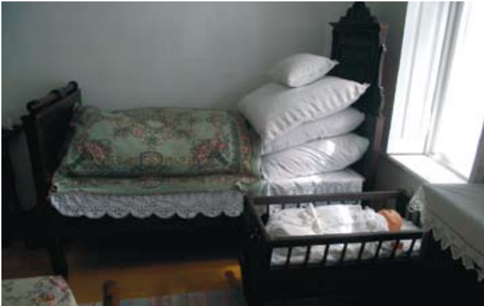
A tájház szobája