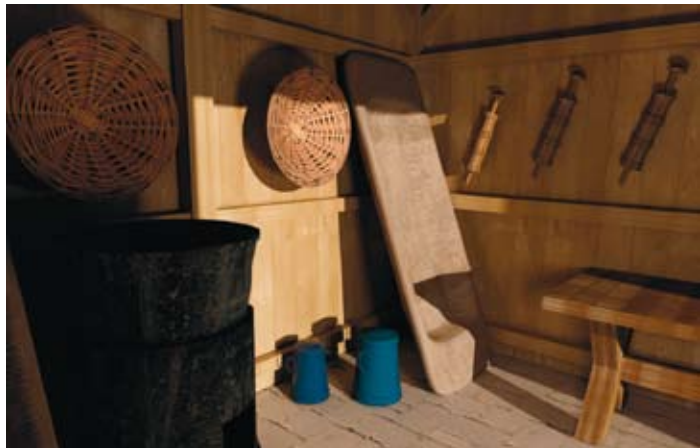
Látványterv: Varga Csaba