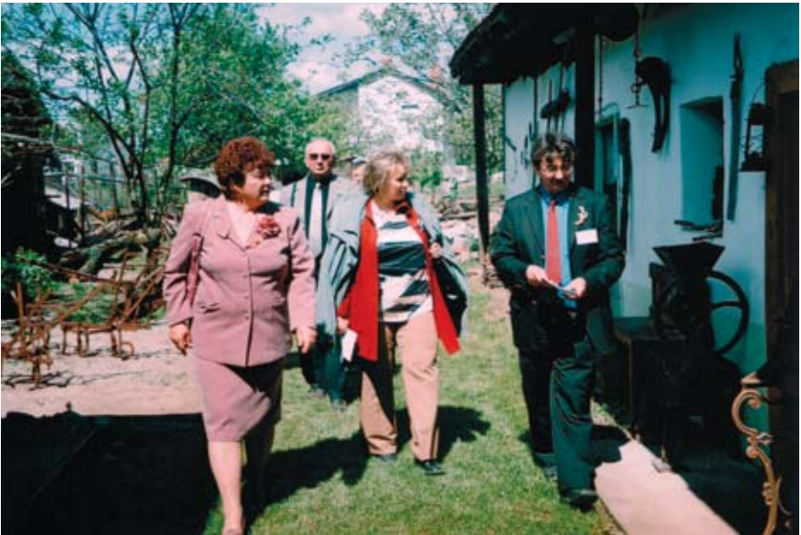
Látogatók a Tájházban

Karel Čapek gondolata erről így hangzik: „ Jsou dva vlivy, které určují charakter člověka – jeho dětství a jeho rodný kraj. ” Két hatás határozza meg az ember jellemét: a gyermekkor és a szülőföld. ( http://www.muzeumhry.cz/cs/muzeum-a-skola/edukatorske-pracoviste )