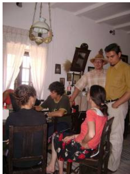
Akció közben a leltározó kommandó